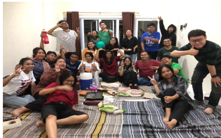
Gambar 2. Peserta yang terdiri dari remaja dan pemuda GKI Gereformeed