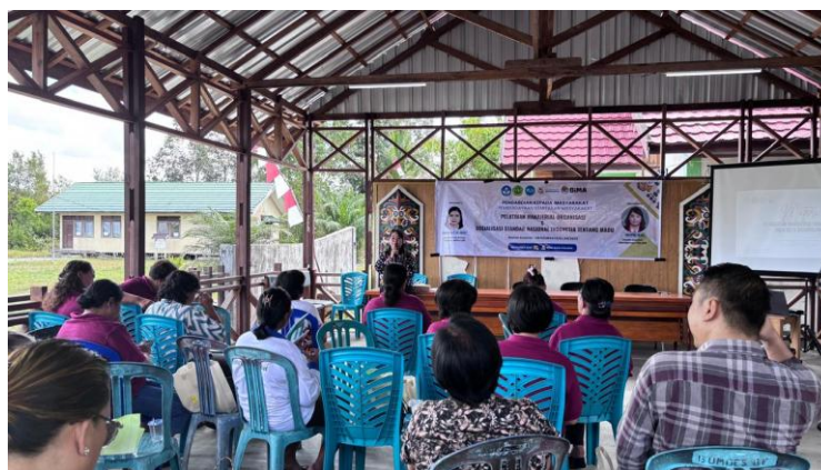
Gambar 2. Pemaparan Materi Terkait Manajerial Organisasi dan Pembukuan Keuangan

Kegiatan pengabdian kepada masyarakat ini dilaksanakan pada tanggal 6 September 2025 di Desa Bahu Palawa, tepatnya di aula kantor. Kegiatan ini dihadiri oleh anggota KUPS Bahu Palawa dan dibuka oleh kepala Desa Bahu Palawa. Kegiatan ini diikuti oleh 22 peserta yang merupakan anggota KUPS Bahu Palawa. Metode yang digunakan dalam kegiatan ini adalah seminar yang dipandu oleh pemateri (Gambar 2). Di awal kegiatan, peserta dibagikan angket untuk diisi terkait transfer pengetahuan yang akan disampaikan pada kegiatan ini.