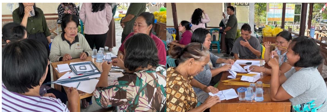
Gambar 3. Permainan Kerja Sama Tim

Materi yang disampaikan pemateri meliputi pentingnya kerja sama tim dalam suatu organisasi dan bagaimana cara memupuknya. Hal ini selaras dengan salah satu permasalahan KUPS Bahu Palawa terkait anggotanya yang kurang aktif dalam berkegiatan bersama KUPS Bahu Palawa. Selanjutnya, pemateri juga memberikan materi terkait pembukuan keuangan melalui pencatatan sederhana yang dapat digunakan peserta sebagai contoh. Pembukuan keuangan ini penting untuk dipahami dengan baik mengingat KUPS Bahu Palawa merupakan kelompok masyarakat produktif yang rutin menghasilkan produk berupa madu kelulut. Dalam sesi presentasi, peserta tampak aktif bertanya kepada pemateri terkait materi yang disampaikan. Seorang anggota KUPS Bahu Palawa menanyakan tentang bagaimana kerja sama tim bisa dipupuk apabila kepercayaan anggota belum terbentuk dengan baik. Pemateri menjelaskan bahwa dalam organisasi kepercayaan harus diimbangi dengan tanggung jawab, jadi apabila sudah diberikan kepercayaan dalam suatu organisasi, sudah seharusnya bisa bertanggung jawab terhadap apa yang dipercayakan.