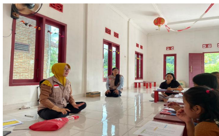
Gambar 4. Kemampuan merespons siswa dalam pembelajaran bahasa Inggris

Pada aspek kemampuan merespons, peningkatan yang cukup tinggi menunjukkan bahwa model ini tidak hanya mendorong keberanian berbicara, tetapi juga memperkuat pemahaman konteks komunikasi. Tahapan Guess dan Think berperan sebagai proses meaning negotiation , di mana siswa tidak hanya menerima input bahasa, tetapi juga mengonstruksi makna secara aktif sebelum menghasilkan output. Proses ini sejalan dengan pendekatan interaction hypothesis yang menekankan bahwa pemahaman bahasa berkembang melalui interaksi dan negosiasi makna (Cai, 2021). Oleh karena itu, peningkatan kemampuan merespons dari 35% menjadi 85% menunjukkan bahwa siswa mulai mampu menggunakan bahasa secara fungsional, bukan sekadar reproduktif.