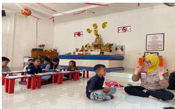
Gambar 3. Peningkatan kepercayaan diri siswa dalam berbicara bahasa Inggris

Selanjutnya, peningkatan kepercayaan diri siswa dalam berbicara menunjukkan bahwa model ini berhasil mengatasi salah satu hambatan utama dalam pembelajaran bahasa kedua, yaitu language anxiety . Tahap Think memberikan ruang kognitif bagi siswa untuk mengorganisasi ide sebelum berbicara, sehingga mengurangi tekanan untuk merespons secara spontan tanpa persiapan. Temuan ini sejalan dengan penelitian (Derakhshan, 2021b) yang menyatakan bahwa lingkungan belajar yang memberikan waktu pemrosesan kognitif serta dukungan emosional dapat meningkatkan keterlibatan dan keberanian siswa dalam menggunakan bahasa kedua. Selain itu, (Xie & Derakhshan, 2021b) juga menegaskan bahwa interaksi yang suportif antara fasilitator dan siswa berkontribusi signifikan terhadap peningkatan kepercayaan diri dalam komunikasi bahasa. Dengan demikian, peningkatan skor kepercayaan diri dari 2,44 menjadi 3,78 tidak hanya bersifat kuantitatif, tetapi mencerminkan perubahan psikologis yang penting dalam proses belajar.