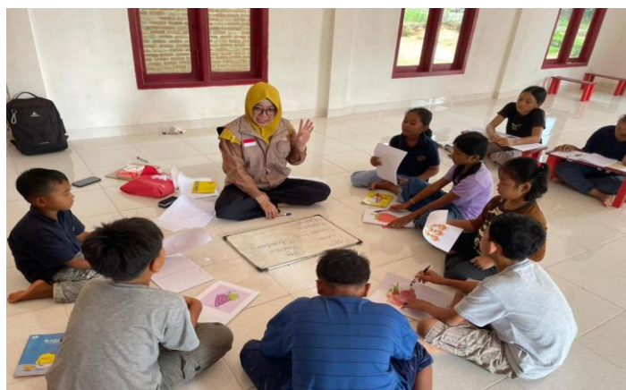
Gambar 2. Partisipasi aktif siswa dalam pembelajaran bahasa Inggris

Peningkatan partisipasi aktif siswa dapat dijelaskan melalui karakteristik model yang menempatkan siswa sebagai subjek utama dalam proses pembelajaran. Tahap Guess berfungsi sebagai engagement trigger yang mampu mengaktivasi pengetahuan awal siswa sekaligus menurunkan hambatan awal dalam berinteraksi. Dalam perspektif Communicative Language Teaching (CLT), keterlibatan aktif siswa merupakan prasyarat utama dalam pembentukan kompetensi komunikatif karena bahasa dipelajari melalui penggunaan nyata dalam konteks sosial (Aswad et al., 2024). Dengan demikian, peningkatan partisipasi dari 30% menjadi 80% menunjukkan bahwa model ini efektif dalam menciptakan ruang interaksi yang sebelumnya tidak tersedia dalam praktik pembelajaran konvensional di Sekolah Minggu Buddha.