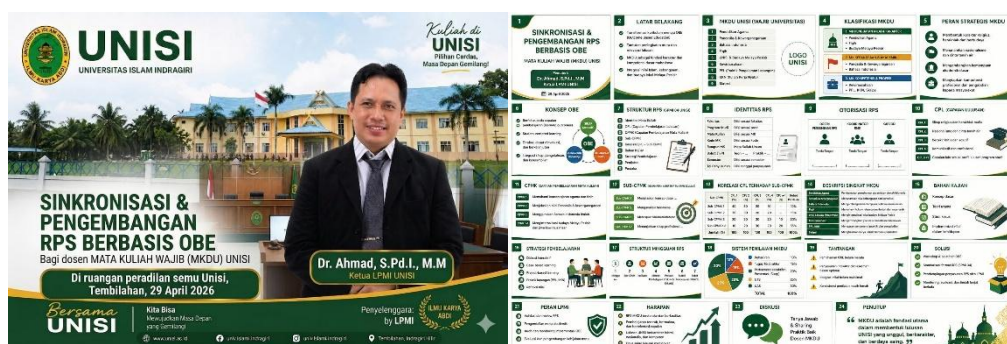
Gambar 2. Dokumentasi Kegiatan Pengabdian Masyarakat

Tabel ini menunjukkan ringkasan pendekatan asesmen inovatif pada tujuh Mata Kuliah Dasar Umum (MKDU) di lingkungan perguruan tinggi. Setiap mata kuliah menerapkan strategi penilaian yang tidak hanya berfokus pada ujian tertulis, tetapi juga pada penilaian autentik berbasis proyek, studi kasus, portofolio, refleksi diri, dan keterlibatan sosial mahasiswa. Inovasi asesmen ini dirancang untuk mengembangkan kemampuan berpikir kritis, kolaboratif, komunikatif, serta penguatan karakter dan keterampilan abad ke-21 yang relevan dengan kebutuhan akademik maupun dunia kerja.