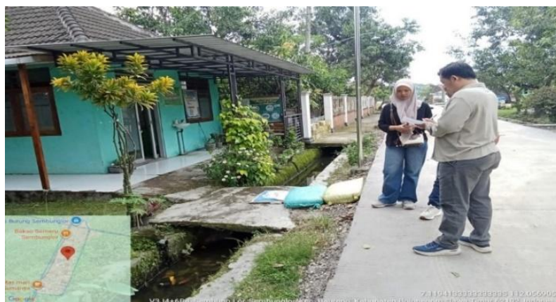
Gambar 3 Pencatatan Hasil Pengukuran

Seluruh hasil pengukuran dicatat secara sistematis sebagai data dasar dalam penyusunan perencanaan teknis drainase. Selama proses pengukuran, tim pengabdian memberikan pendampingan dan penjelasan teknis secara langsung kepada masyarakat terkait fungsi setiap parameter yang diukur serta keterkaitannya dengan kelancaran aliran air hujan. Pendekatan ini memungkinkan masyarakat memahami secara praktis faktor-faktor yang mempengaruhi kinerja sistem drainase di lingkungan mereka. Hasil pelaksanaan pengukuran menunjukkan bahwa beberapa saluran drainase memiliki dimensi yang tidak seragam, kemiringan yang kurang memadai, serta mengalami penyempitan akibat sedimentasi dan aktivitas masyarakat. Temuan ini menguatkan hasil diskusi sebelumnya dan menjadi dasar penting dalam penyusunan konsep perencanaan teknis sebagai solusi pengendalian limpasan air hujan dan peningkatan sanitasi permukiman. Secara keseluruhan, pelaksanaan pengukuran lapangan berjalan dengan lancar dan memberikan data teknis yang valid dan relevan.