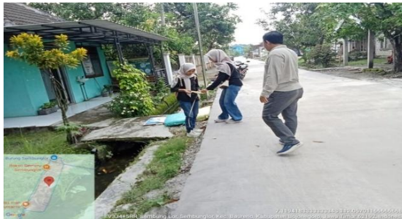
Gambar 2. Pelaksanaan Pengukuran

Pelaksanaan pengukuran lapangan dilakukan sebagai bagian dari kegiatan teknis dalam rangka memperoleh data empiris terkait kondisi eksisting. Kegiatan ini dilaksanakan setelah melalui tahap diskusi pra-pengukuran untuk memastikan bahwa lokasi dan metode pengukuran sesuai dengan permasalahan yang dihadapi masyarakat. Pengukuran dilakukan secara langsung di lapangan dengan melibatkan tim pengabdian dan tokoh masyarakat setempat. Keterlibatan masyarakat bertujuan untuk meningkatkan pemahaman terhadap kondisi teknis drainase sekaligus memastikan bahwa data yang diperoleh mencerminkan kondisi riil di lingkungan permukiman. Objek pengukuran meliputi saluran drainase eksisting, kondisi lahan sekitar, serta titik-titik yang berpotensi menjadi lokasi genangan air saat hujan. Jenis pengukuran yang dilakukan antara lain pengukuran dimensi saluran (lebar dan kedalaman), pengamatan kondisi fisik saluran, serta pengukuran kemiringan lahan dan arah aliran air. Selain itu, dilakukan pula identifikasi terhadap hambatan aliran seperti sedimentasi, tumbuhan liar, dan tumpukan sampah yang dapat mengurangi kapasitas saluran.