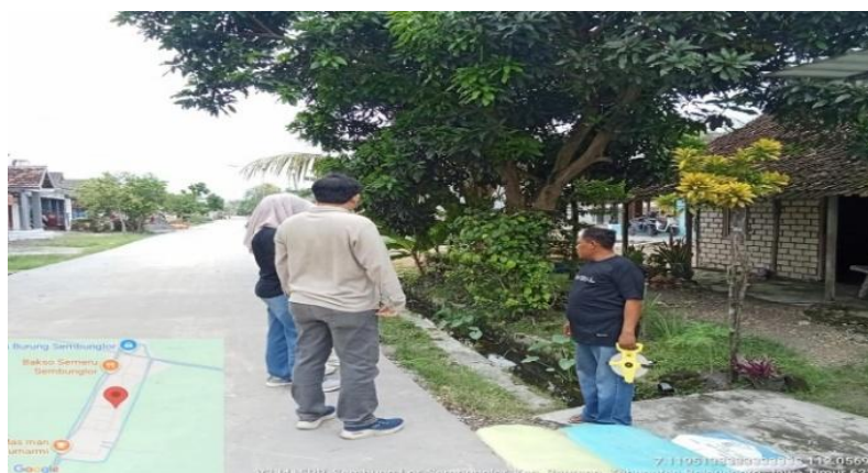
Gambar 1. Supervisi dan koordinasi lapangan

Selain itu, pendampingan juga menghasilkan meningkatnya partisipasi dan kepedulian masyarakat terhadap kebersihan dan keberlanjutan fungsi saluran drainase. Masyarakat menunjukkan keterlibatan aktif dalam diskusi, praktik lapangan, serta penentuan lokasi prioritas penanganan. Hal ini menunjukkan adanya perubahan sikap dari sebelumnya pasif menjadi lebih proaktif dalam menjaga lingkungan permukiman. Sebelum pelaksanaan kegiatan pengukuran teknis di lapangan, tim pengabdian melaksanakan diskusi awal bersama perwakilan tokoh masyarakat sebagai langkah strategis untuk menyamakan persepsi dan memahami kondisi riil di lapangan. Diskusi ini bertujuan untuk menggali informasi awal terkait permasalahan drainase dan sanitasi yang selama ini dirasakan oleh masyarakat, sekaligus sebagai dasar dalam menentukan metode dan lokasi pengukuran yang tepat.