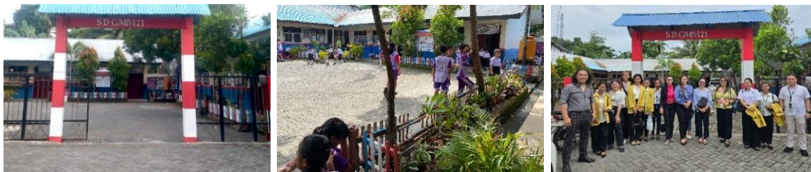
Gambar 2. Foto SD GMIM 21 Manado dan Observasi Tim Kerja

temuan ini kepada kepala sekolah, dan diputuskan/disepakati untuk membuat kegiatan PKM berupa edukasi tentang anti-bullying untuk warga sekolah di SD GMIM 21 Manado. Berikut foto SD GMIM 21 Manado: