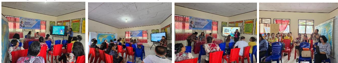
Gambar 4. Foto Kegiatan Seminar Edukasi Anti Bullying