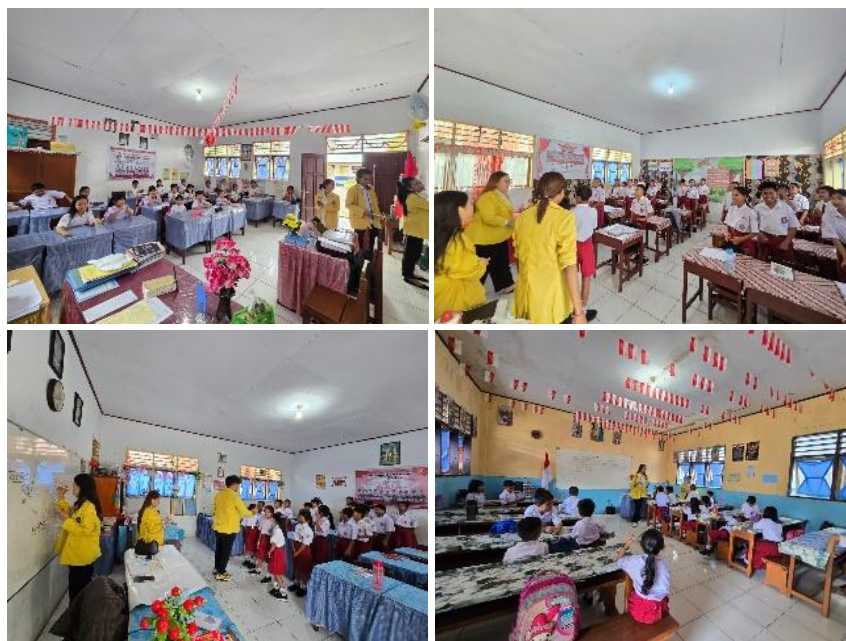
Gambar 5. Foto Kegiatan Pembelajaran “Pendidikan Karakter”