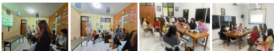
Gambar 3. FGD Tim Kerja PKM FIP

Selanjutnya pada tanggal 28 Oktober 2025 dilaksanakan FGD kedua oleh Tim Kerja. Dalam FGD ini, Tim Kerja membicarakan teknis pelaksanaan PKM, yakni susunan acara, job description masing-masing anggota tim, perampungan materi masing-masing narasumber, sampai pada pembagian mahasiswa yang akan mengajar di kelas 1 – 6 lengkap dengan materi yang akan diberikan kepada siswa (berbentuk modul ajar pembelajaran mendalam). Selain itu, Tim Kerja juga menyiapkan bahan dan alat yang akan digunakan dalam PKM, dan berkoordinasi dengan pihak sekolah untuk teknis acara dan waktu/jam pelaksanaannya. Berikut foto 2 kali kegiatan FGD Tim Kerja: